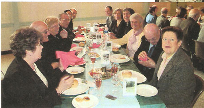
Repas des Aînés.