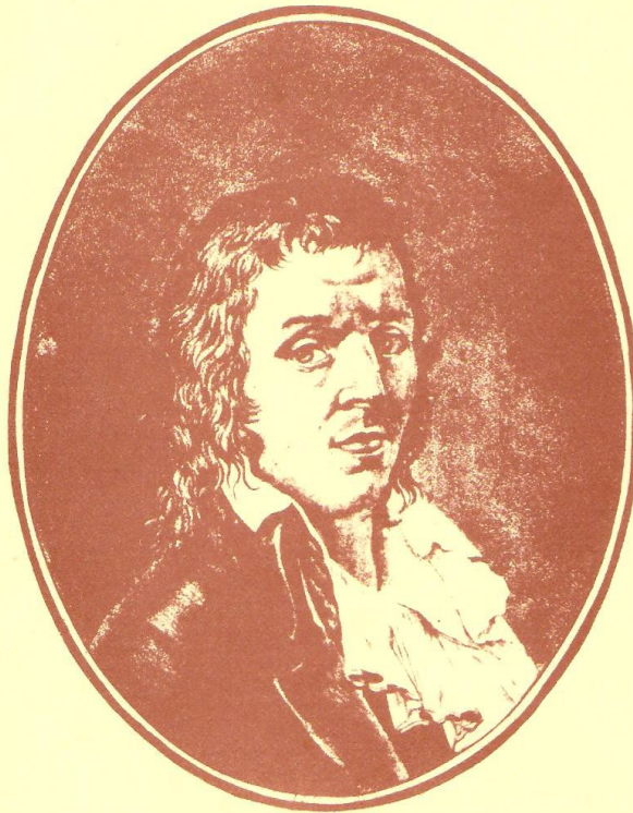
PHOTO D'UNE ESTAMPE DE LA BIBLIOTHEQUE NATIONALE

François-Noël (dit "GRACCHUS")BABEUF PHILOSOPHE ET REVOLUTIONNAIRE