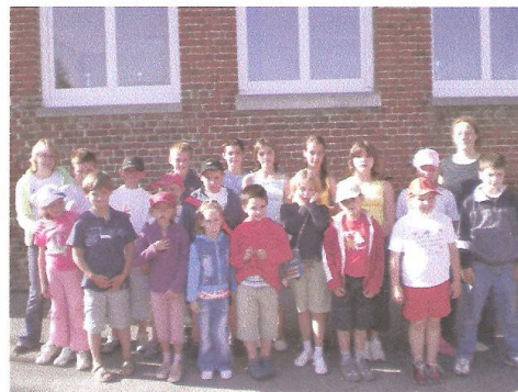
Le groupe des moyens et des grands