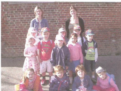
Le groupe des petits

les enfants nous feront partager leur joie en nous présentant chants, danses et sketches. Ils comptent sur la présence de « tout le village ».