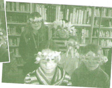
Masques réalisés pendant les vacances de Février avec les enfants.

Ce bulletin, tiré à 330 exemplaires, est sorti des presses de FOLIO 7 à Péronne, son pendant est également diffusé sur le Web : www.monchylagache.fr